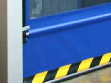
Detalle de bolsa de lona de puerta rápida apilable