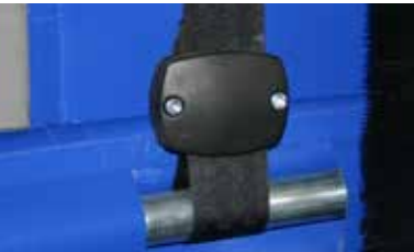
Enganche de cintas